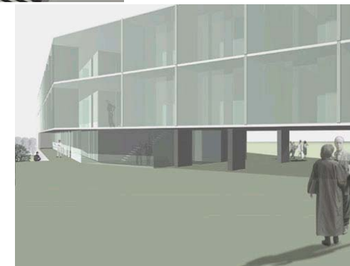
Bilder: archiscape Architekten und Landschaftsarchitekten Berlin